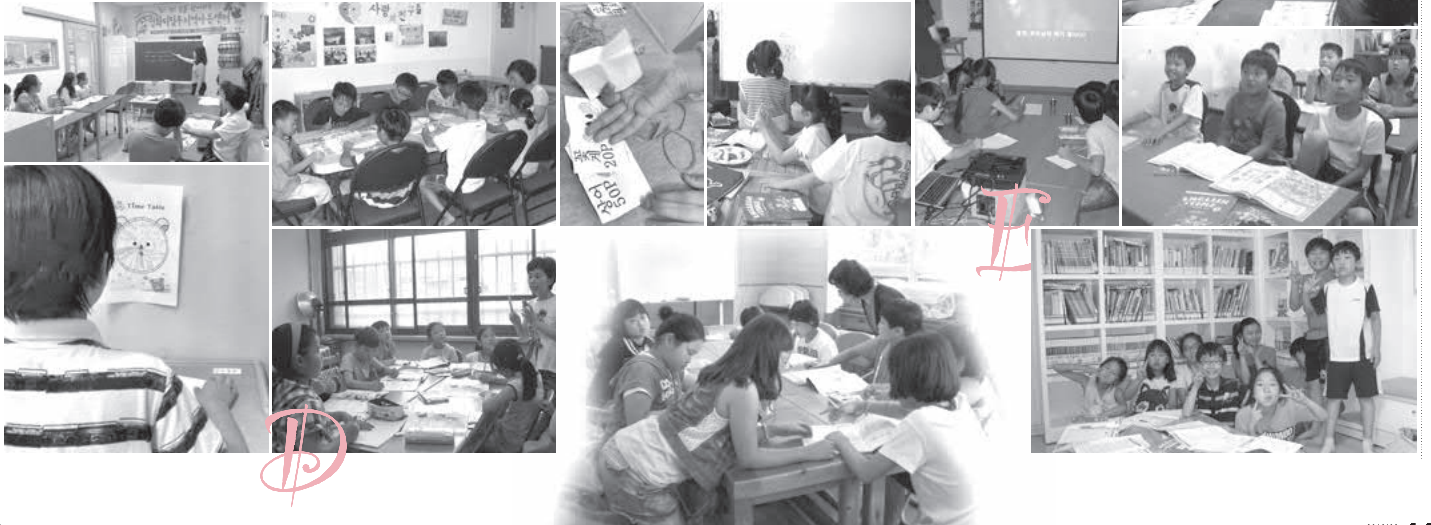
미래를 여는 영어교실 어린이들이 사용하고 있는 교재와 가방