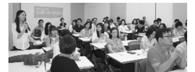
■ 2015년 하반기 : 9월 4일 서울시민청 워크숍룸 ■ 2016년 상반기 : 3월 8일 여성플라자 세미나실

미래를 여는 영어교실 평가회는 지역아동센터 교사와 자원봉사자가 6개월에 한 번씩 한자리에 모여 미래를 여는 영어교실을 통해 어린이들의 이야기와 다양하고 재미난 수업방식을 공유하고, 더 나은 영어교실이 되기 위한 진행 방향 등을 서로 이야기하는 자리이다. 다양한 방식으로 수업을 이끌며 어린이들에게 영어수업을 제공하고 있는 자원봉사자들에게는 감사의 마음을 전하는 시간도 함께 마련하고 있다.