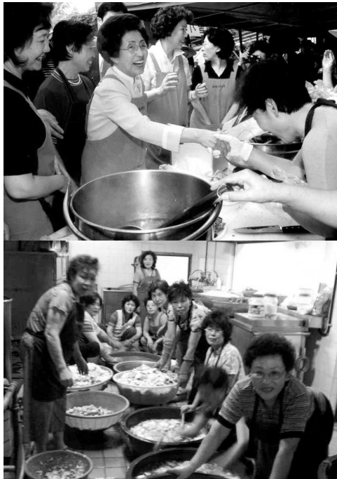
바지에서 유명한 '한마음표 육개장' 판매중(위) 김치 담고있는 한마음 봉사회 회원들(아래)

그뿐만이 아니다. 자식들의 눈치를 받는 일 없이 점심이라도 함께 드시라고 56군데의 경로당에 쌀을 보내고 2003년부터는 형편이 어려운 어린이들을 위